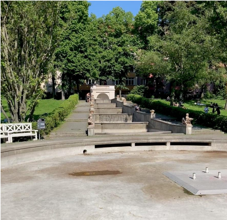
Wasserloser Brunnen im Körnerpark, Berlin Neukölln.

Es ströme aber das Recht wie Wasser und die Gerechtigkeit wie ein nie versiegender Bach.